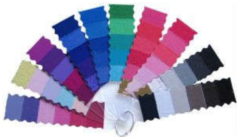
Eén kleurenpalet is inbegrepen in de prijs van het startpakket.

Deze Master Color Set heb je nodig om de training te kunnen volgen.