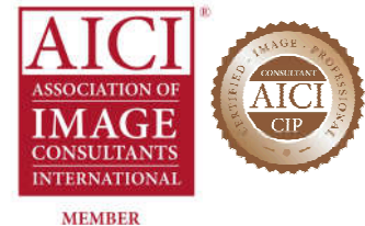
Image Companion verzorgt ook de volgende opleidingen / trainingen :